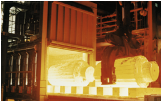
Ofen in der Stahlindustrie

● = Standard, ○ = lieferbar; 1) ohne Kegelringverschraubung