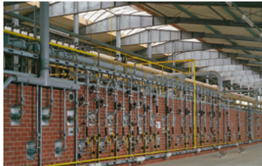
Elster Kromschroder-Armaturen in der Keramikindustrie