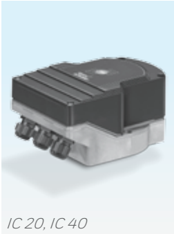
IC 20, IC 40