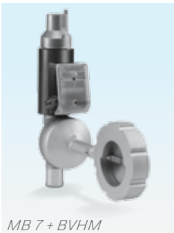
MB 7 + BVHM