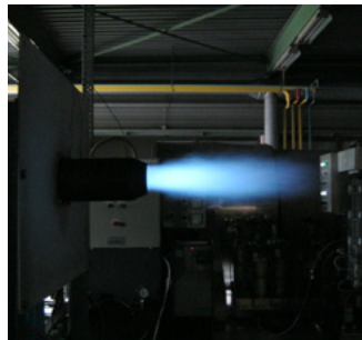
100 % природный газ