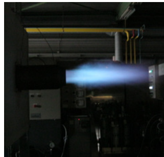
Соотношение природный газ/водород 20/80