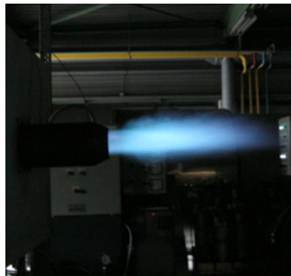
Соотношение природный газ/водород 40/60