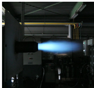
100 % природный газ