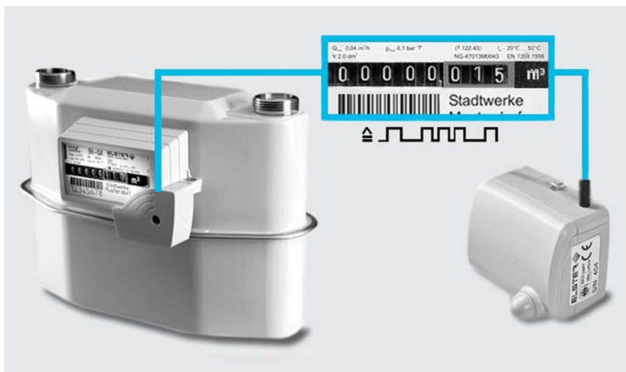
Schematische Darstellung der Übertragung des Originalzählerstandes mittels der SCR-Schnittstelle an einen batteriebetriebenen Transponder zur Fernauslesung